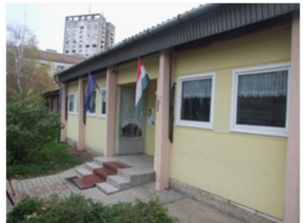
Szolnok, Kolozsvári út 21.